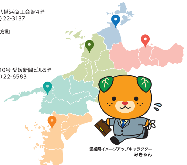
愛媛県イメージアップキャラクター みきゃん

〒798-0040 宇和島市中央町1丁目9番10号 愛媛新聞ビル5階 TEL(0895)22-6556 FAX(0895)22-6583 【業務区域】 宇和島市・鬼北町・松野町・愛南町