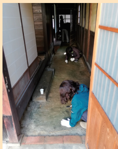
開業前の改装は地域住民の方にお手伝いいただきました

サラリーマン時代に赴任した大洲の人の温かさ、町並みに惚れ込み、「大洲の為に何かしたい!」と思っていたところ、貴重な縁でこの建物をご紹介いただき、創業を決意しました。地域の方々のおかげで、この町らしい温かい雰囲気のお店になりました。