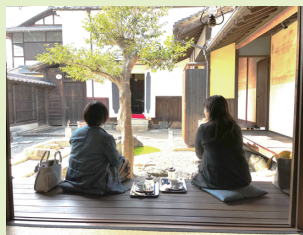
好評の縁側でのカフェタイム

カフェ開業後は三密を避けて、中庭の縁側に座ってもらうなど、コロナ禍でも安心して過ごせる空間造りしました。